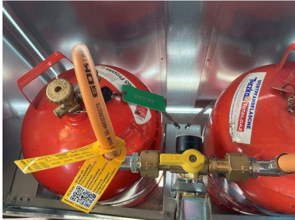
Bild: Gasschrank mit Flaschen (Sicht von oben aus dem Küchenfenster)

Der Gasschrank mit zwei 11kg Gasflaschen befindet sich auf der Südseite der Hütte unter dem Küchenfenster. Der Gasschrankdeckel lässt sich bei geöffnetem Fenster von der Küche aus anheben, so dass von dort aus die Gasflaschen zugänglich sind.