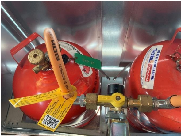
Bild: Gasschrank mit Flaschen (Sicht von oben aus dem Küchenfenster)

Der Gasschrank mit zwei 11kg Gasflaschen befindet sich auf der Südseite der Hütte unter dem Küchenfenster. Der Gasschrankdeckel lässt sich bei geöffnetem Fenster von der Küche aus anheben, so dass von dort aus die Gasflaschen zugänglich sind.