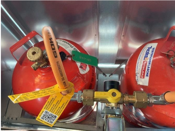
Bild: Gasschrank mit Flaschen (Sicht von oben aus dem Küchenfenster)

Der Gasschrank mit zwei 11kg Gasflaschen befindet sich auf der Südseite der Hütte unter dem Küchenfenster. Der Gasschrankdeckel lässt sich bei geöffnetem Fenster von der Küche aus anheben, so dass von dort aus die Gasflaschen zugänglich sind.